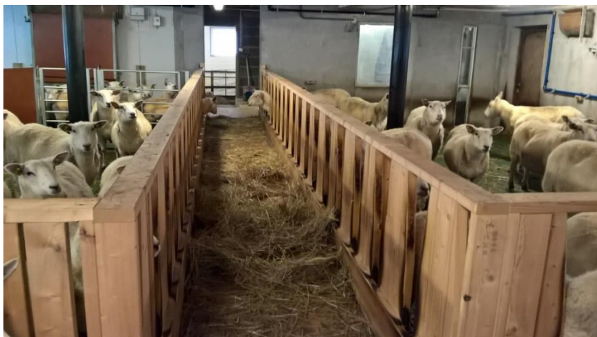
Bilde 2: Bilde av dagens løsnings.