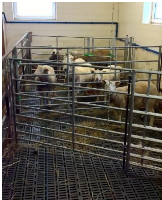
Bilde 1: Bilde av dagens løsning.

Hvis det blir for kostnads- eller arbeidskrevende å oppfylle forskriften, vurderes det å legge om saueholdet til konvensjonell drift. Dagens fjøs gir plass til 100 konvensjonelle sauer, med et areal på 1 m 2 /sau.